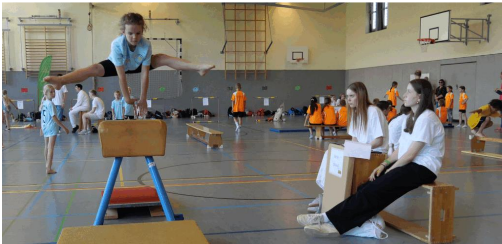
Bilder vom Bezirksfinale 2024 in Rheda-Wiedenbrück