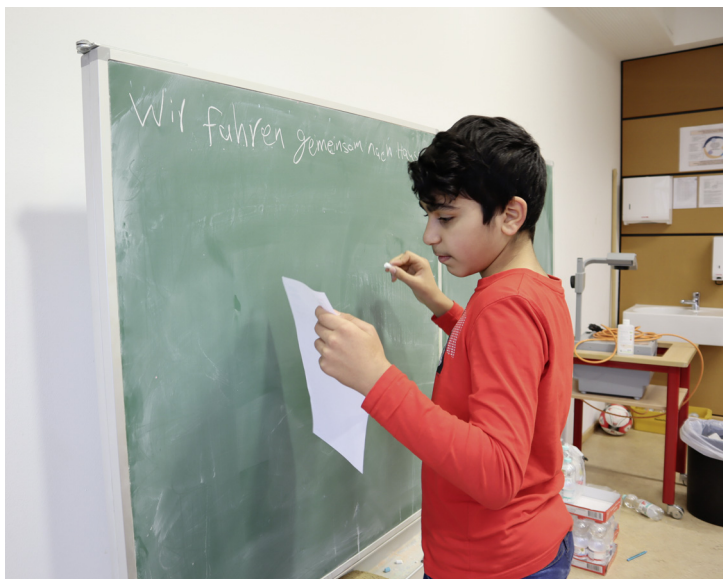
Bei den Sprachcamps erarbeiten die Kinder in den Kursen Lösungen für Grammatikaufgaben.

* davon 5 Europaschulen im Kreis Gütersloh