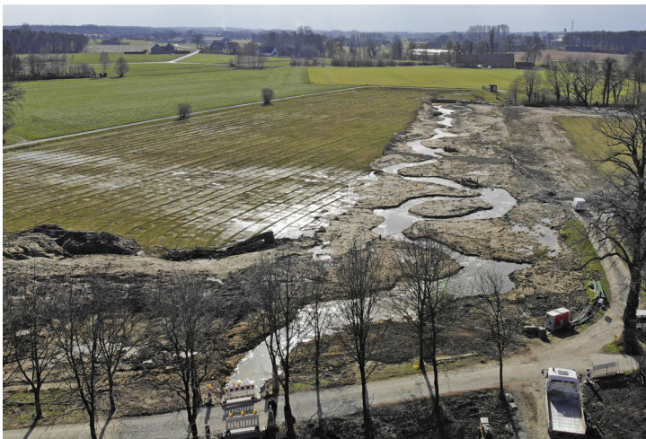
Auf einer Länge von ungefähr 300 Metern schlängelt sich das neugestaltete Bachbett des Bockhorster Bachs durch das Ravensberger Hügelland bei Borgholzhausen.