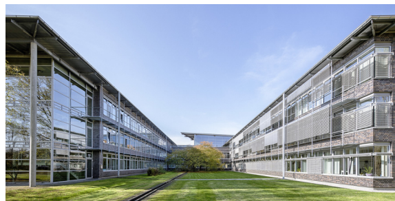
Kreishaus Gütersloh

neuen Kreis Gütersloh aufgingen, wurden 1815 durch Preußen gegründet. In ihrer geschichtlichen Herkunft weisen die Gebietsteile des heutigen Kreises Gütersloh auf sechs verschiedene ehemalige Herrschaftsbereiche zurück: Grafschaft Ravensberg (alter Kreis Halle/Gütersloh teilweise); Bistum Osnabrück/Amt Reckenberg (Langenberg teilweise, Teile von Rheda-Wiedenbrück und Gütersloh); Herrschaft Rheda (Herzebrock-Clarholz, Teile von Rheda-Wiedenbrück und Gütersloh); Grafschaft Rietberg (Rietberg, Verl, Schloß Holte-Stukenbrock teilweise); Bistümer Münster (heutige Stadt Harsewinkel, der Ortsteil Benteler von Langenberg und das Gebiet um Möhler, zu Herzebrock-Clarholz gehörig) und Paderborn (Ortsteil Stukenbrock der Stadt Schloß Holte-Stukenbrock).