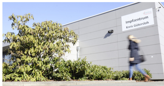
Das Impfzentrum des Kreises Gütersloh.

Lange Straße 173, 33397 Rietberg, Tel. 052 44/90 19-32