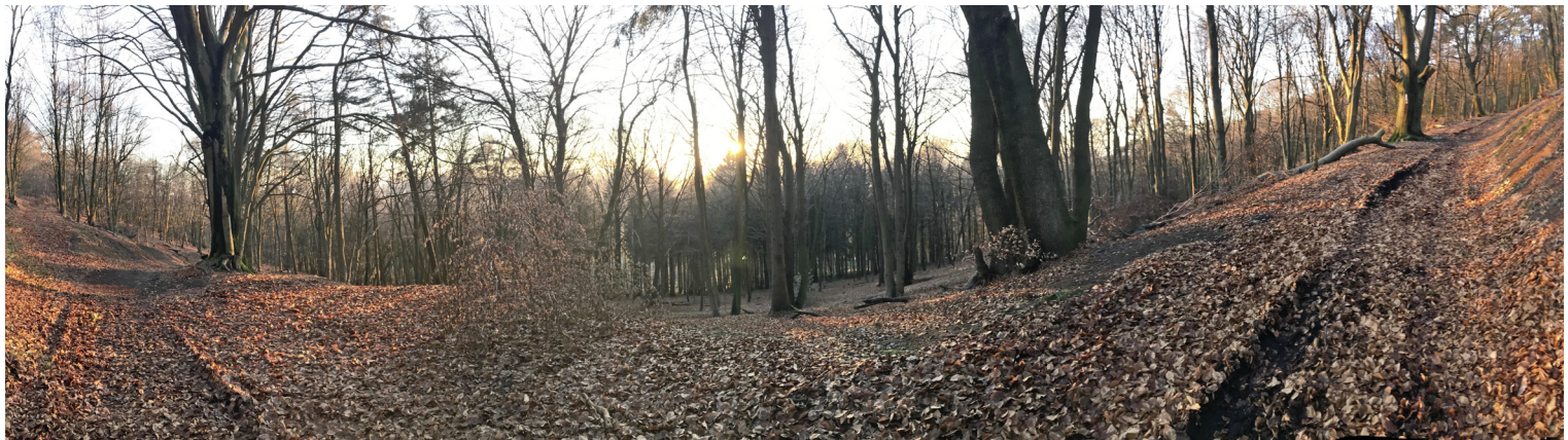
Der Bergweltenweg in Steinhagen führt als Rundwanderweg über Teile des „Wegs für Genießer“ ( www.genieesserweg.de ) und über die sieben Berge: Hohe Liet, Gottesberg, Petersberg, Bußberg, Pasterkemper Berg, Emilshöhe und Jakobsberg.

*** Sonstige: BU, BfGT, move, Offene Liste Rheda-Wiedenbrück, CSB, UWG/Die Partei, fraktionslos, DIE FREIEN, Werther – Das geht anders!