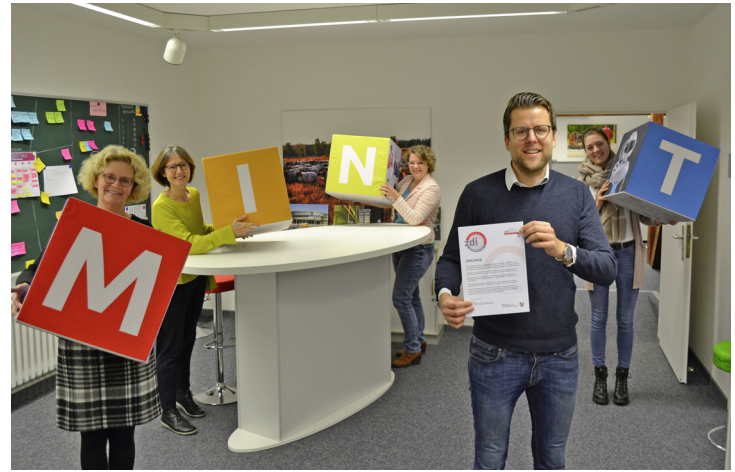
Das Team von pro MINT GT freut sich über das Qualitätssiegel 2020/2021. Das Siegel bestätigt besonders engagierte Förderung des Nachwuchses im MINT-Bereich.

*2 Betriebe mit mehr als 20 Beschäftigten, Quelle: IT.NRW