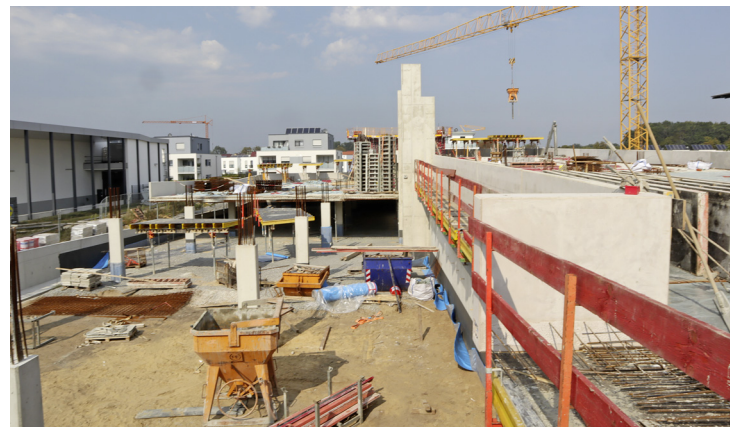
Die Bauarbeiten am neuen Parkhaus am Kreishaus in Gütersloh, Stand: September 2020.