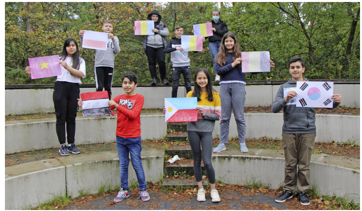
Kinder präsentieren stolz ihre selbstgemalte Heimatflagge während der Sprachcamps in den Herbstferien.